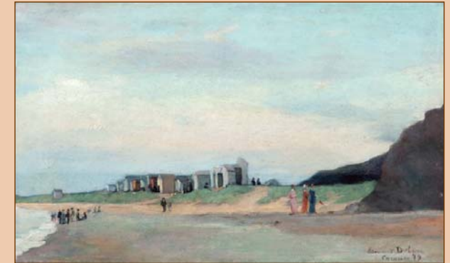
La plage de Carolles, 1879. Huile sur toile, Coll. part.