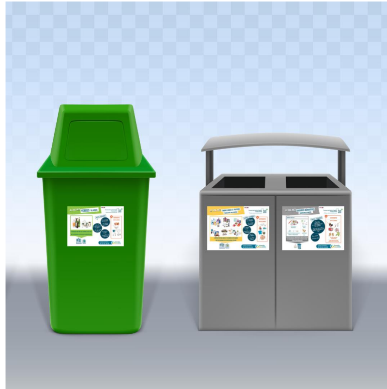
Stickers 3 flux