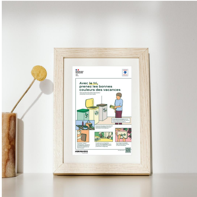
Affiche à encadrer